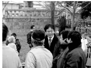
門司区の大里地区にて