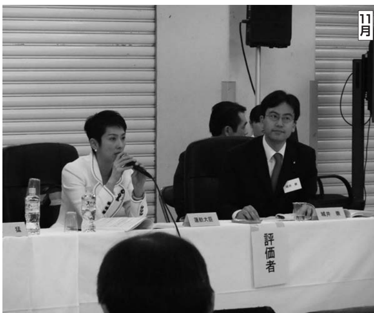
11月 事業仕分け第3弾で仕分け人を務める。写真は通称行政刷新担当大臣。