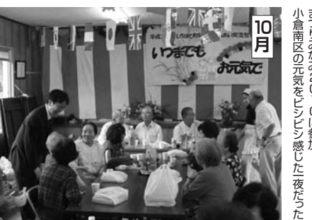
10月 中興地区の政老会にて年長の先陣と語り。おこなった。おこなった。おこなった。