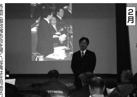
2月 各地で国政報告会を開く。写真は庄地区。丁寧に生活の声を伺うことを心がける。