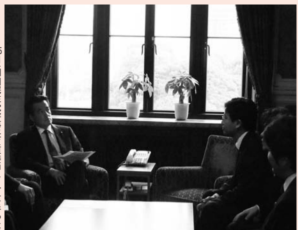
▲11月25日、岡田民主党幹事長に直接申し入れをうけた

私は、企業団体献金の禁止を求める国会議員署名の呼びかけ人として、約140名を超える賛同者を集め、岡田克也民主党幹事長に直接申し入れました。政治の信頼回復のため、徹して頑張ります。