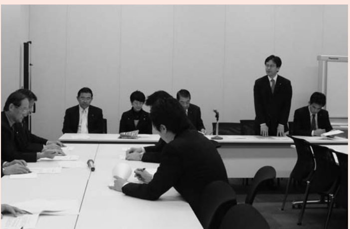
▲民主党カネミ油症対策を進める議員連盟第1回会合

発症から43年が経過した我が国最大の食品公害「カネミ油症」の被害者支援を国の関わりの中で進めるべく、改めて「民主党カネミ油症対策議員連盟」を有志議員とともに立ち上げました。私は幹事長を拝命。高齢化の進む被害者の状況をこれ以上看過することはできません。今後、「国による認定患者の医療費支給の確保」や「原因究明・治療法の確立の促進」を進める根拠となる法律の制定を超党派の議員立法で目指します。