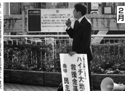
2月 ハイチ大地震復興支援の募金活動。小倉駅前で行った時は快挙でした。