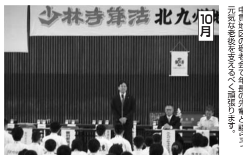
10月 少林寺拳法北九州支部大会。おこなった。おこなった。おこなった。