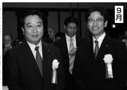
9月 きいたかしとラテン音楽を楽しむ会。おこなった。おこなった。おこなった。