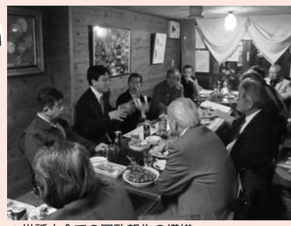
▲世話人会での国政報告の模様

きいたかしは個人献金主体の政治活動実現のために、趣旨を理解し支援して下さる個人支援者を募っています。協力可能な方、月額1口500円の個人献金(会費として預かります)をぜひお願いいたします。*詳しくはきいたかし後援会事務所までお問い合わせください。