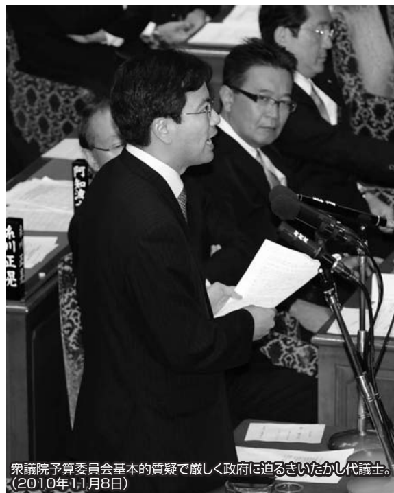
衆議院予算委員会基本的質疑で厳しく政府に迫るきいたかし代議士。(2010年11月8日)

おかげさまで国政復帰から1年4カ月余り、一日一日手を抜かず、頑張っているところです。本年前半は、衆院予算委員、文部科学委員、海賊テロ特別委員長を拝命。また、特別会計検証チーム主査や事業仕分け第2弾の仕分け調査員事務局など、「霞ヶ関埋蔵金」の確認を含めた税金のムダづかいの見直しに全力を挙げました。秋の臨時国会からは予算理事を拝命、予算規模約5兆円(事業費ベースで約21兆円)に上る緊急経済対策 我が国の新成長戦略を盛り込んだ平成22年度補正予