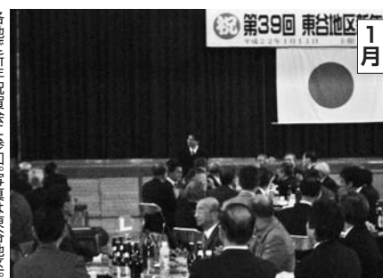
1月 第39回 関東地区 各地で新年総会に参加。写真は奥地区。皆さんと熱い話し合いの場を創りました。