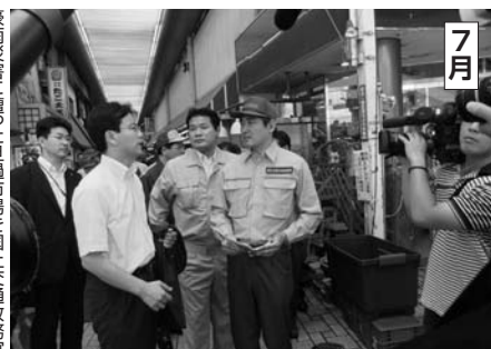
7月 豪雨災害に連日自治体を単身で訪問。おこなった。おこなった。おこなった。