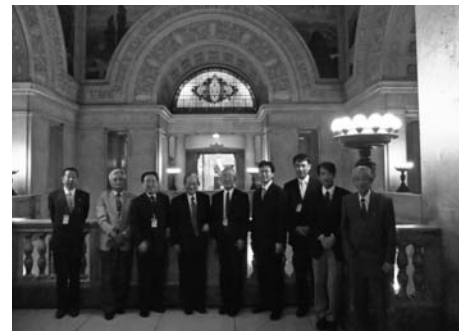
▲きいたかし会の国会見学ツアー。