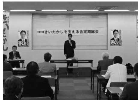
▲きいたかしを支える会総会の模様。

後援会の皆様のご支援のおかげでこの1年間の活動を頑張れました。ありがとうございます!