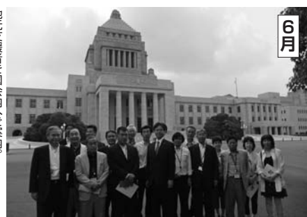
6月 地元支援者国会内へ。おこなった。おこなった。おこなった。