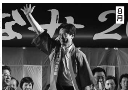
8月 小倉地区の政老会にて年長の先陣と語り。おこなった。おこなった。おこなった。