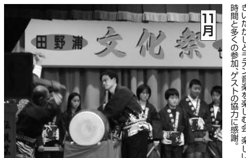
11月 田野浦市民センター文化祭。おこなった。おこなった。おこなった。