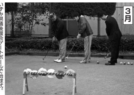
3月 いずみ興産後援会イベント。おこなう市議と市議とで話し合いました。