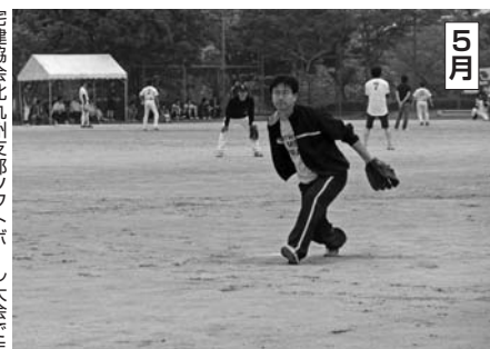
5月 若狭湾北九州支部ソフトボール大会。おこなった。打撃の練習から。