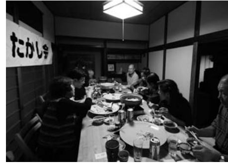
▲10区たかし会国政報告会の1枚。