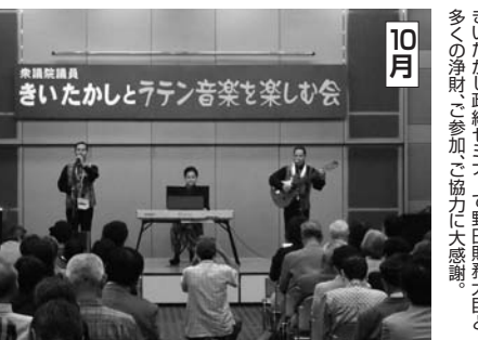
10月 きいたかしとラテン音楽を楽しむ会。おこなった。おこなった。おこなった。