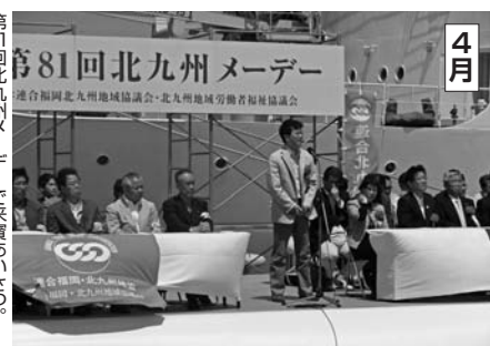
4月 第81回北九州メーデー。北九州地域労働者協議会。北九州地域労働者協議会。北九州地域労働者協議会。