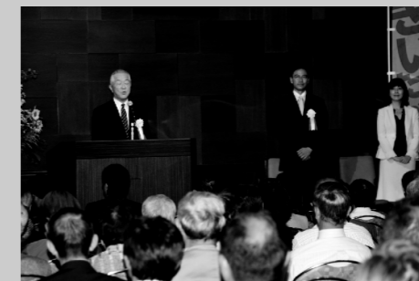
選挙報告会を開催していただく。政権党の衆議院議員として、多くの皆様のご支援に感謝感謝。実との取り組み合いに挑む!