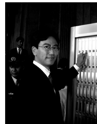
登院ボタンを4年ぶりに自らの手で。