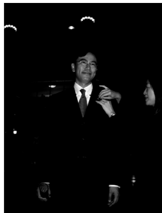
議員バッジ、しっかり預かりました。