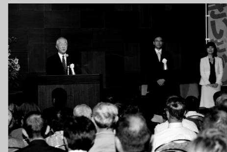
選挙報告会を開催していただく。政権党の衆議院議員として、現多くの皆様のご支援に感謝感謝。実との取っ組み合いに挑む!